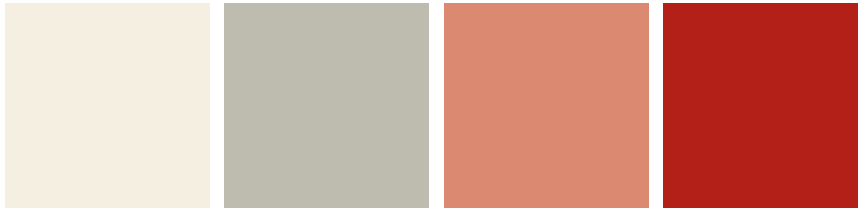
4030 (RAL 9001) Cremeweiß Cream Blanc crème